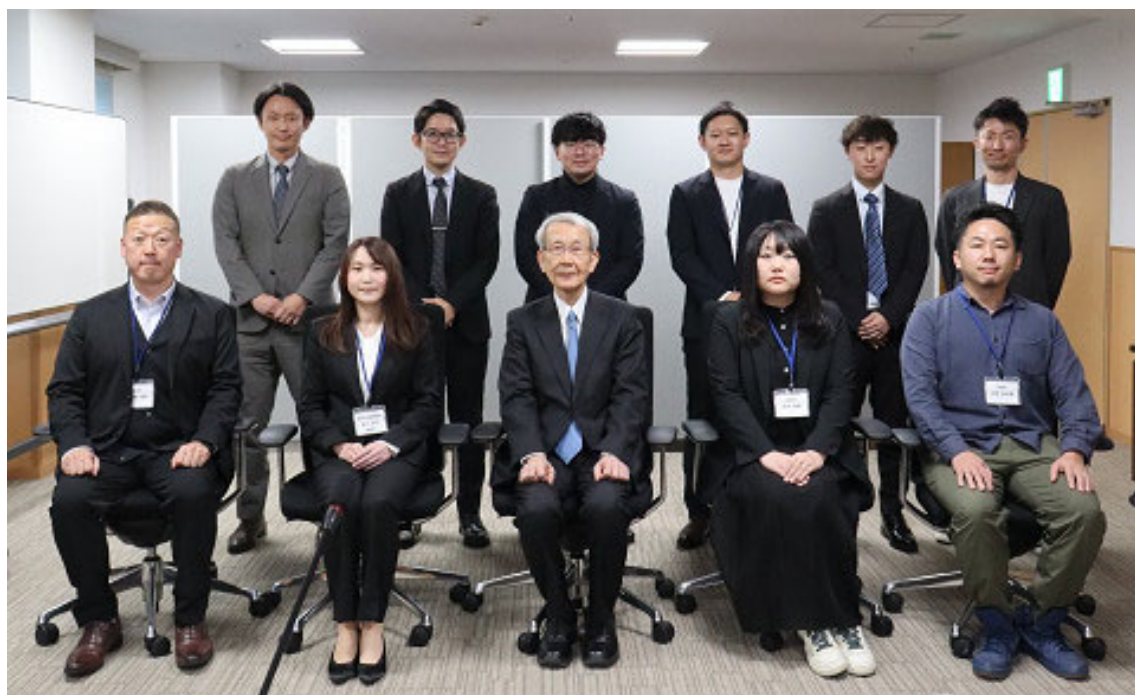
令和7年度政策力形成ゼミナール参加者と主任講師