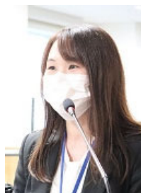
写真はゼミナール参加者と講師陣

令和 8 年 3 月 公益財団法人 北海道市町村振興協会 一般社団法人 地域研究工房