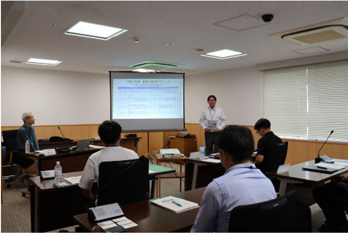
主催者からの挨拶